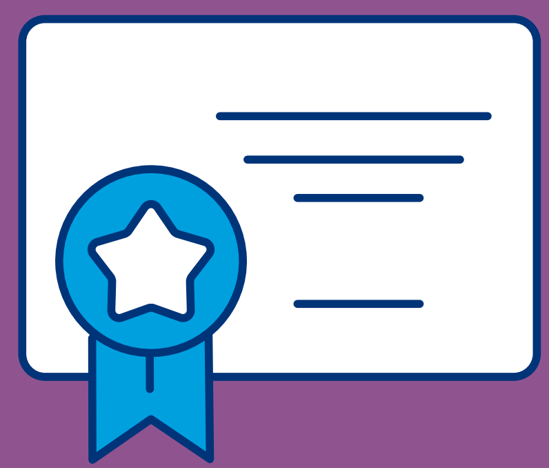
CAPACITAÇÃO E APRIMORAMENTO INSTITUCIONAL