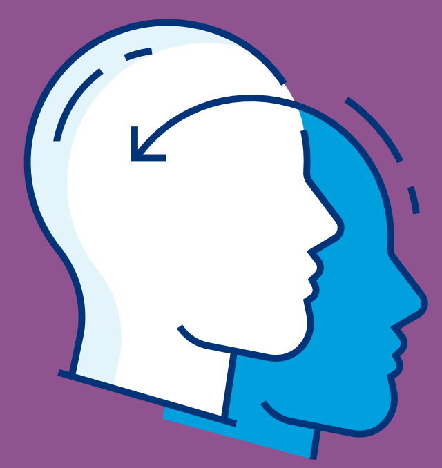
CONSCIENTIZAÇÃO DA SOCIEDADE