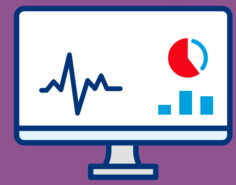
GERAÇÃO DE DADOS DE DOENÇAS