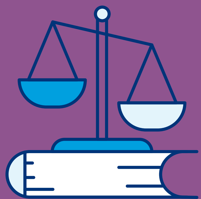
ADVOCACY E POLÍTICAS PÚBLICAS

Serão considerados projetos que sigam as seguintes linhas de atuação: