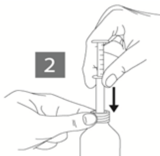
Figure 2 : Introduire la pipette dans le flacon.