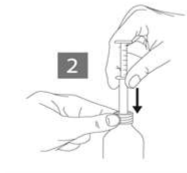
Figure 2 : Introduire la pipette dans le flacon.