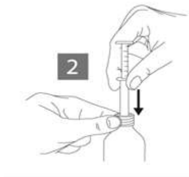
Figure 2 : Introduire la pipette dans le flacon.