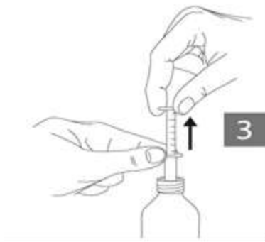
Figure 3 : En tenant la bague inférieure de la pipette, ajuster la bague supérieure au niveau correspondant au nombre de millilitres ou milligrammes dont vous avez besoin.