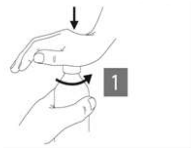
Figure 1 : Le flacon est muni d'un bouchon à l'épreuve des enfants.

Ouverture du flacon et utilisation de la pipette :